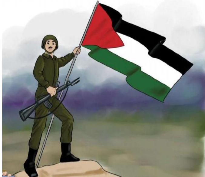
(שפתנו היפה, כתה א', חלק ב' (2020) עמ' 83)

3. המאבק לשחרור כפי שהוא מוצג לתלמידי כתה א':