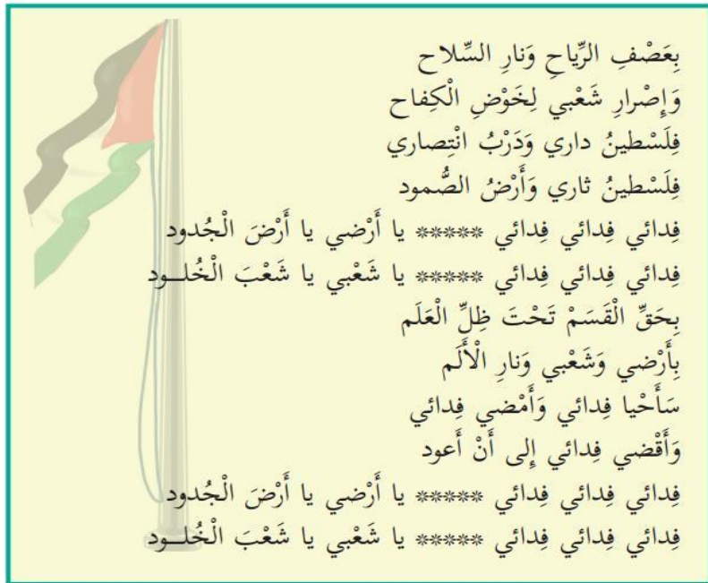
(טיפוח לאומי וחברתי, כתה ג', חלק א' (2020) ע"ע 16 – 17. ההדגשות הוספו)

3. המאבק לשחרור כפי שהוא מוצג לתלמידי כתה א':