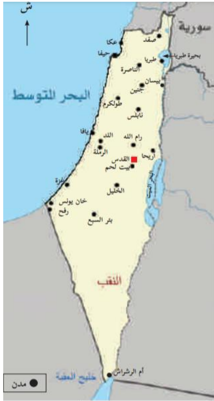
رقم (1): خريطة فلسطين

9. בהיותם נחשבים למתיישבים זרים, אין היהודים בארץ נמנים בין תושביה, והערים שבנו, כולל תל אביב, נעדרות מעל גבי המפה שבספרי הלימוד בבתי ה"ס של אונר"א. המפה המוצגת כאן בכותרת "מפת פלסטין" אינה מראה את הערים האלה כלל, חוץ מאילת המופיעה תחת השם הערבי של המקום השומם שבו נבנתה אח"כ – "אום אלרשאש".